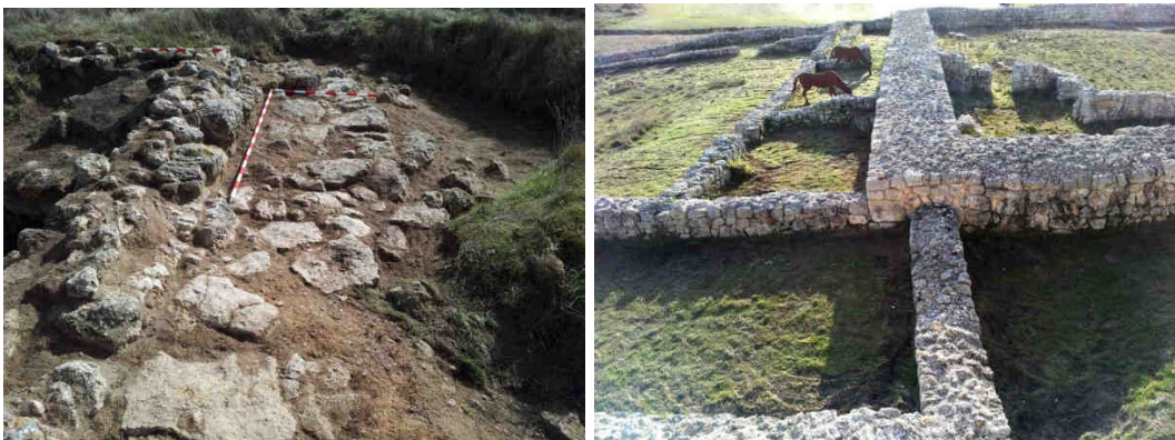
Excavaciones arqueológicas y zona de almacenes de la fortaleza de Fuenteungrillo

Pasaremos por las principales calles de Fuenteungrillo , hasta las puertas de la villa, donde a través de una visión de conjunto, comprenderán la acción del hombre sobre el medio y cuáles son los condicionantes que inciden a la hora de elegir un emplazamiento de estas características.