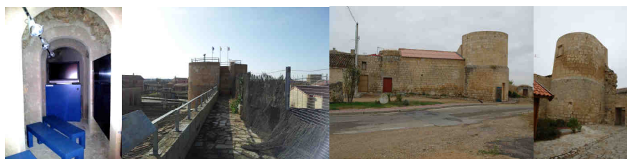
Adarve y cubos visitables de la muralla de Villalba de los Alcores

Al terminar los talleres, los alumnos, volverán al autocar para desplazarse al pueblo de Villalba de los Alcores, y una vez que han asimilado conceptos claves como restos arqueológicos, urbanismo medieval, signos de poder feudal, etc. Podremos encontrar muchos de estos elementos que nos imaginamos en Fuenteungrillo, para verlos ahora en pie, como la puerta de la villa, los cubos de la muralla, el adarve, iglesias, etc.