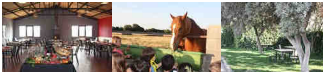
Instalaciones de la Finca Monte Beco en Villalba de los Alcores

Una vez finalizada la visita a Villalba de los Alcores, se ofrece la posibilidad de disfrutar de una comida tipo picnic o de un menú caliente en la Finca Montebeco , donde después de comer, realizaremos más actividades de tiempo libre hasta el fin de la jornada.