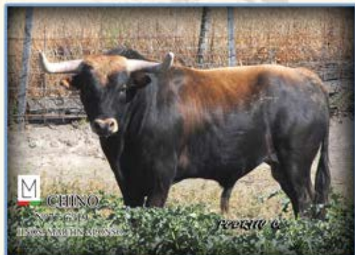
CHINO N°77 G°19 HNOS. MARTÍN ALONSO