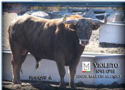
VIOLETO N°91 G°19 HNOS. MARTÍN ALONSO