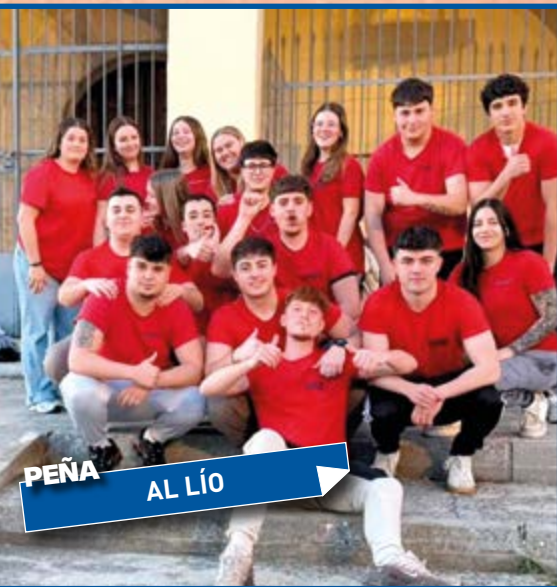
PEÑA AL LÍO