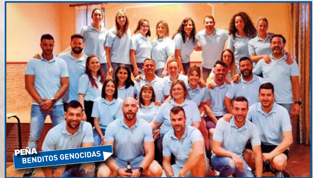
PEÑA BENDITOS GENOCIDAS