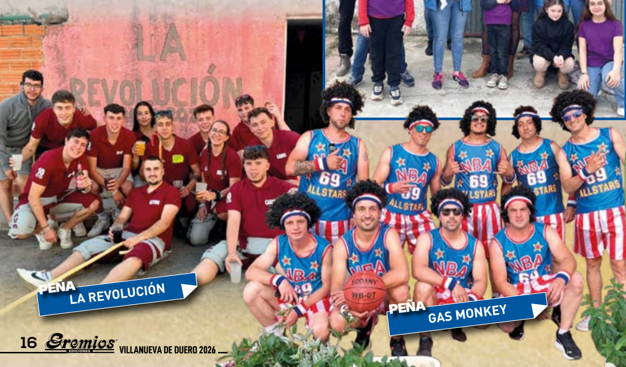
PEÑA LA REVOLUCIÓN