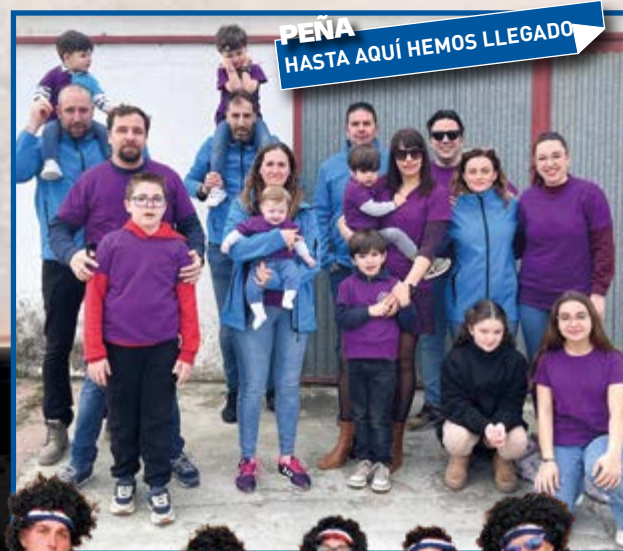
PEÑA HASTA AQUÍ HEMOS LLEGADO

Peñas las cuales desde décadas se reúnen para festejar a sus patrones o peñas que los más pequeños, futuro de Villanueva, crean por afinidad y cercanía, peñas que ahora vienen con sus hijos recién llegados y peñas de padres e hijos que ya de mayores vuelven a convivir.