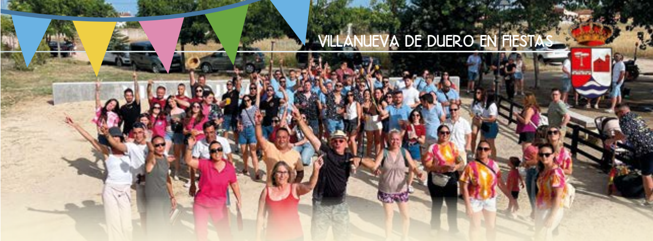
VILLANUEVA DE DUERO EN FIESTAS

19.00 h Fiesta de la Espuma para todos los públicos en la Piscina Municipal. 22.00 h Baile en la Plaza Mayor a cargo de la Orquesta "MEDIA LUNA". Entrega del Premio a la Peña Más Participativa 2026.