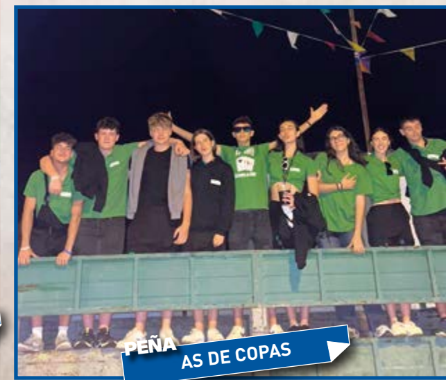
PEÑA AS DE COPAS

rante estos días llenando el municipio de color, alegría y buen ambiente para propios y extraños.