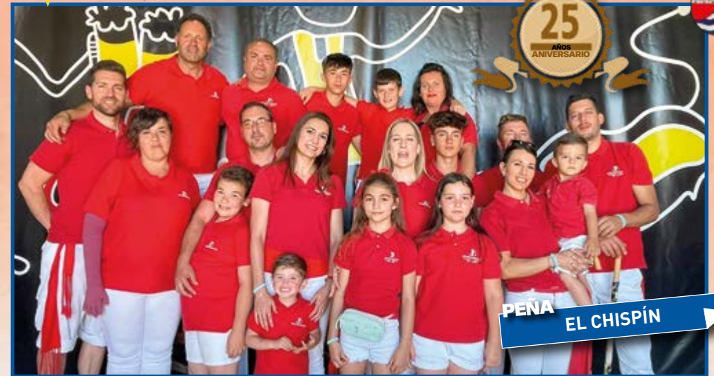
PEÑA EL CHISPÍN

Peñas las cuales desde décadas se reúnen para festejar a sus patrones o peñas que los más pequeños, futuro de Villanueva, crean por afinidad y cercanía, peñas que ahora vienen con sus hijos recién llegados y peñas de padres e hijos que ya de mayores vuelven a convivir.