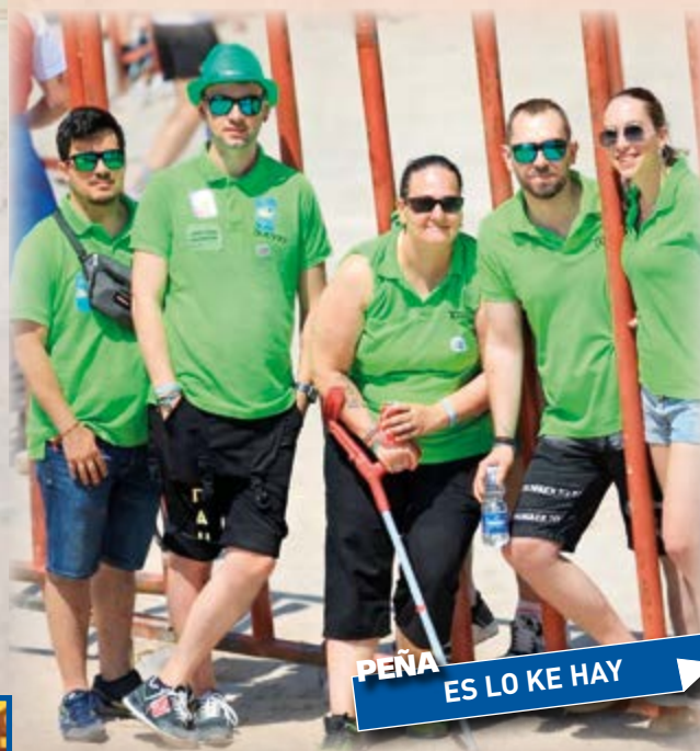
PEÑA ES LO KE HAY

rante estos días llenando el municipio de color, alegría y buen ambiente para propios y extraños.