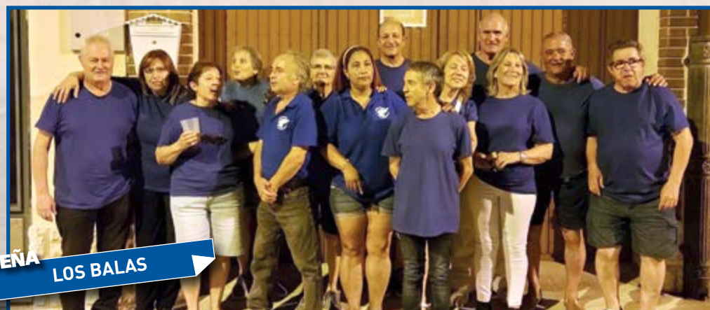
PEÑA LOS BALAS

Al hablar de Fiesta con mayúsculas, su sinónimo en Villanueva de Duero es Peñas, sin ellas no sería posible encontrar este ambiente festivo y jovial para todo el que se acerca hasta aquí.