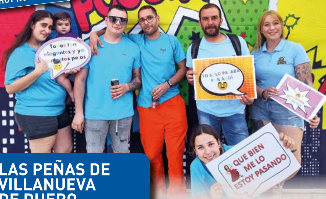
PEÑA HOY NO ME LÍO