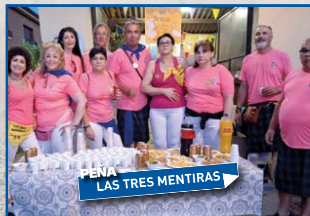
PEÑA LAS TRES MENTIRAS