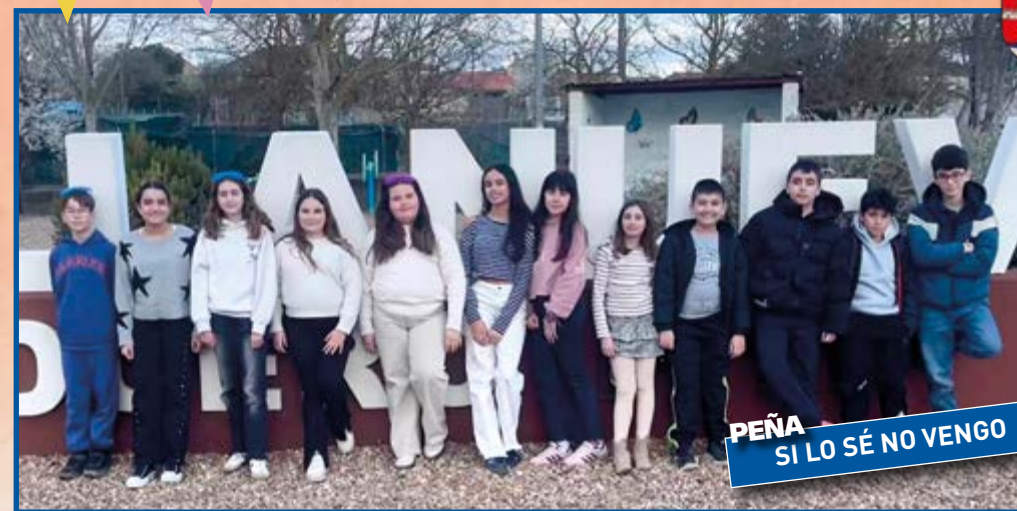
PEÑA SI LO SÉ NO VENGO

Al hablar de Fiesta con mayúsculas, su sinónimo en Villanueva de Duero es Peñas, sin ellas no sería posible encontrar este ambiente festivo y jovial para todo el que se acerca hasta aquí.