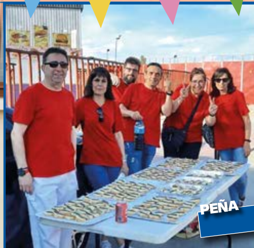
PEÑA LA ROJA