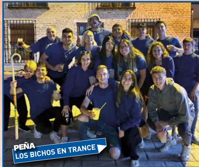
PEÑA LOS BICHOS EN TRANCE