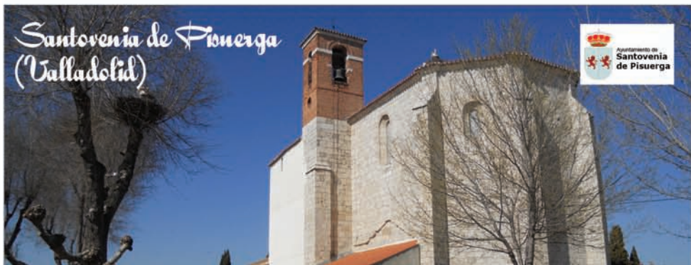
Santovenia de Pisuerga (Valladolid)